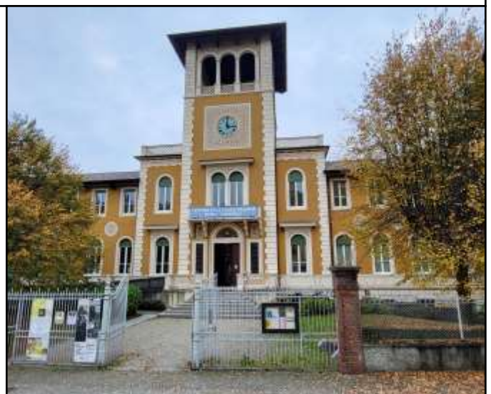
Waldensermuseum in Torre Pellice