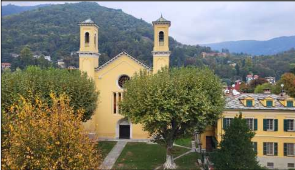
Kirche in Torre Pellice

Im Rahmen der Veranstaltungsreihe „ 500 Jahre Evangelisch in Bad Homburg “ führt unsere Evangelische Kirchengemeinde Bad Homburg vom 03. bis zum 10. Oktober 2026 eine Waldenserreise in die Waldensertäler im Piemont/Norditalien durch.