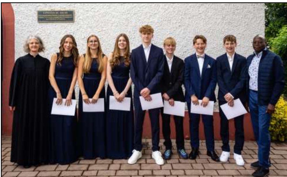
Die Konfi-Gruppe (v.l.n.r.)

Das Highlight war, dass die Konfirmanden und Konfirmandinnen ihren Konfirmationsgottesdienst zum Thema „Was gibt mir Halt im Leben?“ vorbereitet und durchgeführt hatten. Dafür hatten sie Texte ausgewählt, über ihre persönlichen Bibeldverse gesprochen, ein paar Lieder geprobt und einstudiert, den Ablauf zusammengestellt und die Predigt vorbereitet. Es war schön zu sehen, wie jede und jeder von ihnen etwas ganz Eigenes eingebracht hat.