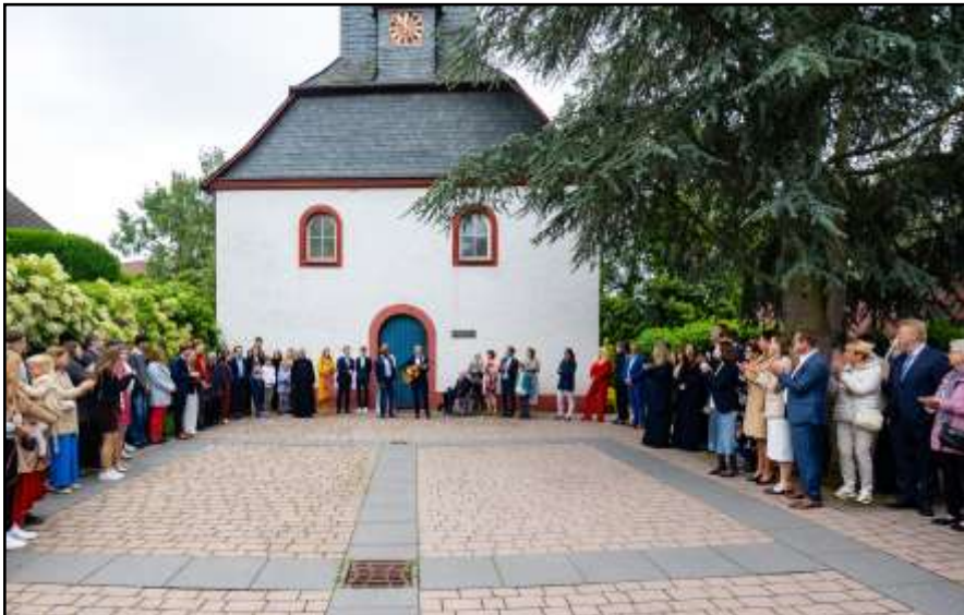
Das Abendmahl mit über 140 Gottesdienstbesuchern fand (erstmalig) auf dem Kirchenvorplatz der Ev. Waldenser-Kirchengemeinde statt.

Zusammen als Konfigruppe hatten wir in dieser Zeit nicht nur viel über den christlichen Glauben gelernt, sondern auch über uns selbst, über Gott und die Welt. Und was es bedeutet, Teil der Waldensergemeinde und Waldensergemeinschaft zu sein. Diese Fragen begleiteten uns.