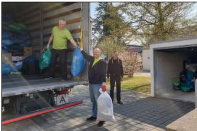
Abholung der Kleidersäcke im April 2021

Dornholzhäuser Straße 12 61350 Bad Homburg v. d. Höhe